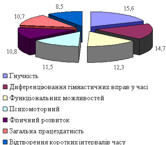
Рис. 2. Факторна структура показників, які визначають ефективність початкової підготовки гімнасток 8 років.

Показники “гнучкості” склали, в основному, зміст першого фактору (15,6%), частка впливу котрого достатньо вагома в загальній структурі підготовленості гімнасток.