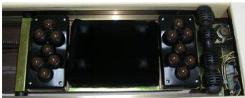
Рис. 2. Основной конструктивный и рабочий элементы термомассажного ложа SAMMI SM-6000.

Сравнивая глубокий аппаратный массаж от движения валиков с классическим, следует считать его близким, по сути, к растиранию, вибрации и разминанию, проводимому глубоким надавливанием пальцем, где воздействие пальца удачно заменено воздействием валиков подвижной каретки [7].