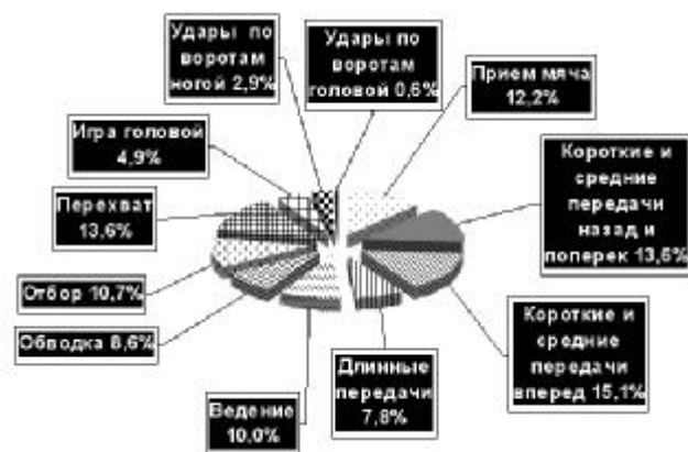
Рис. 3. Структура основных компонентов соревновательной деятельности футболистов 17 лет по количеству выполняемых технико-тактических действий за матч

Несколько иную структуру основных компонентов соревновательной деятельности имеют футболисты 17 лет (рис. 3).