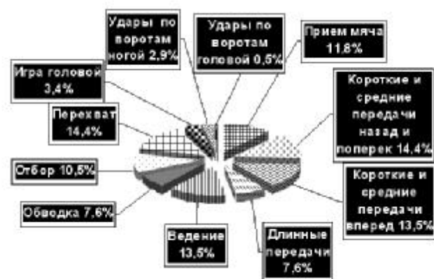
Рис. 1. Структура основних компонентів змагальної діяльності футболістів 15 років по кількості виконуваних техніко-тактичних дій за матч

Розглядаючи частоту використання різних технічних прийомів футболістами 15 років очевидно (рис. 1), що ними в більшій мірі виконуються короткі і середні передачі назад і поперек (14,4%), перехвати (14,4%) і короткі і середні передачі вперед (13,5%). При цьому найбільш високий коефіцієнт браку відзначено (рис. 2) при ударах головою (60%) і при довгих передачах (55%).