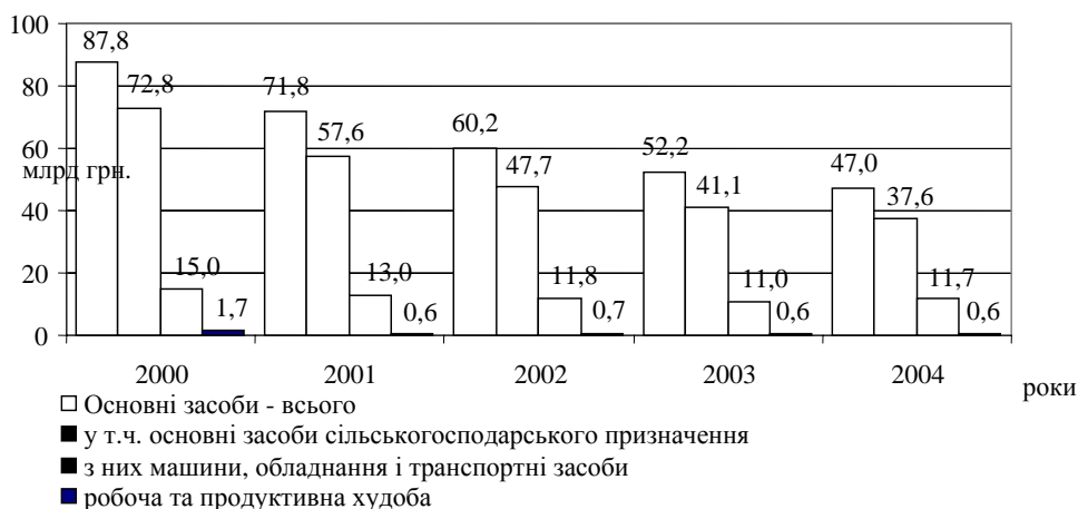
Рис. 2. Вартість майна аграрних підприємств, що може бути використане як потенційна застава*

Невтішною є тенденція зменшення обсягів ліквідної застави – машин, обладнання, транспортних засобів, робочої та продуктивної худоби (рис. 2).