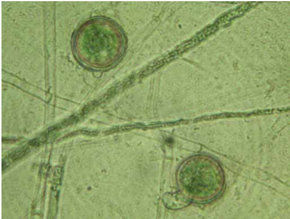
Рис. 1. Гіфи міцелію та ооспори Pythium ultimum var. ultimum (1200*)

У пізніші етапи розвитку ярого ріпаку гриби роду Pythium зустрічались значно рідше до 25-30 % від загальної кількості виділених збудників(табл. 1).