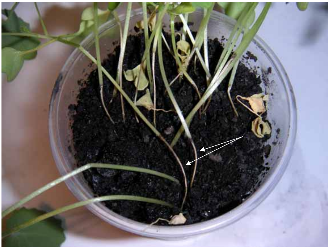
Рис. 2. Рослини Brassica napus L. з перетяжками на нижній частині стебла під дією P. ultimum var. ultimum

Чисту культуру P. ultimum var. ultimum ми використали для перевірки патогенності в лабораторних умовах. З цією метою її вносили в стерильний ґрунт, у який висівали дезинфіковане насіння ріпаку. Цей вид виявився дуже агресивним (табл. 2), оскільки при найменшій використаній нами кількості інокулюму із 83% рослин, що зійшли, 80% було уражено (рис.2).