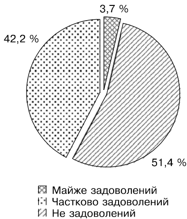
Рис. 1. Оцінка стану дитячо-юнацького футболу в Україні

футболістів, якою охоплено більше 1 млн молодих людей. Вінчає систему дитячо-юнацького футболу України Дитячо-юнацька футбольна ліга ФФУ, в змаганнях якої у сезоні 2003—2004 рр. стартували 414 команд та близько 9,5 тисячі молодих футболістів [3].